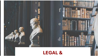
LEGAL & CORPORATE GOVERNANCE