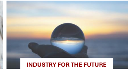
INDUSTRY FOR THE FUTURE & INVESTMENT SOLUTIONS