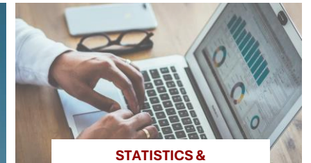
STATISTICS & TRENDS